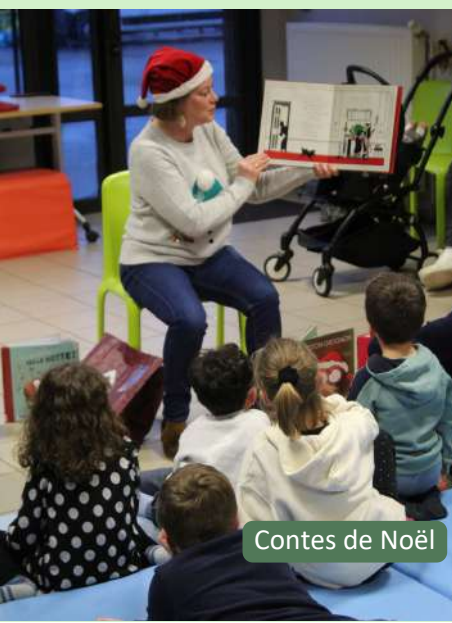
Contes de Noël