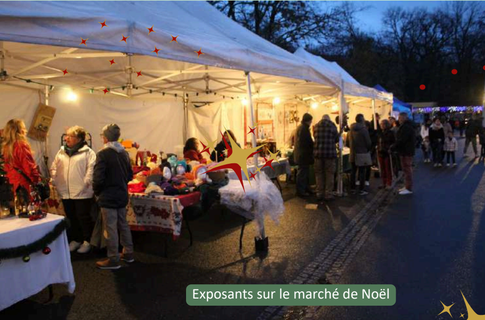
Exposants sur le marché de Noël