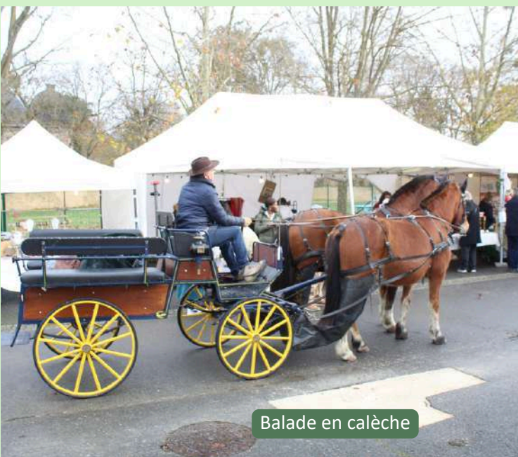
Balade en calèche