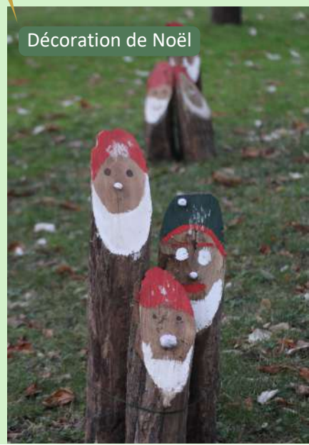
Décoration de Noël