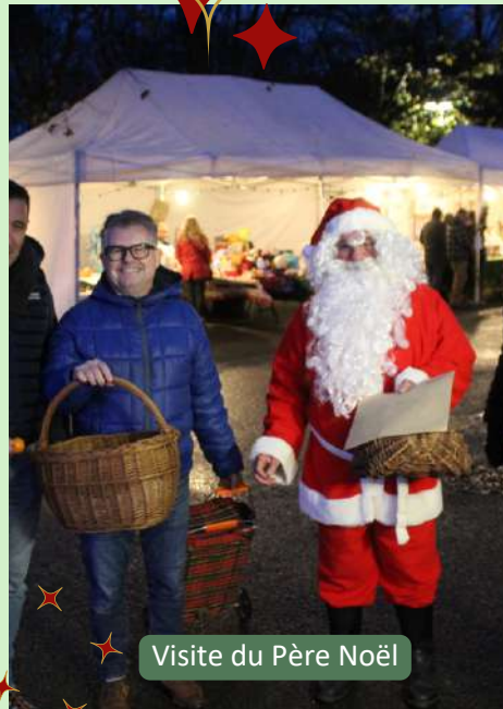
Visite du Père Noël