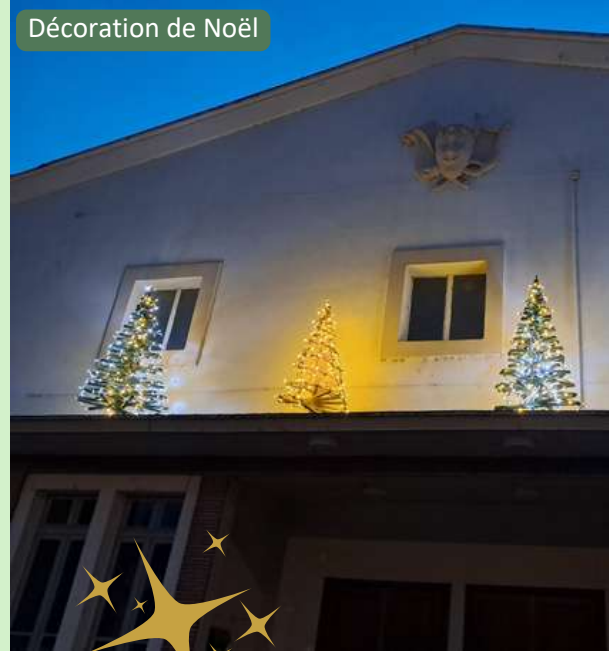
Décoration de Noël